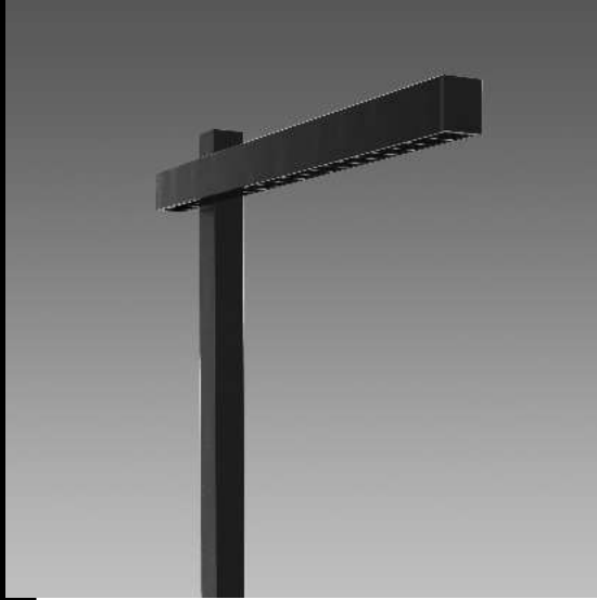
Liset 2.0 OFFICE 1 - fixe - optiques confort éclairage direct + diffuseur opale éclairage indirect

Liset 2.0 est un luminaire linéaire et modulaire. Il simplifie la composition de l'éclairage qui peut adopter plusieurs configurations, quelle qu'en soit l'application : commerce de détail, contextes architecturaux et culturels, espaces d'accueil et/ou structures d'hébergement. Compact, élégant, polyvalent et peu encombrant, Liset 2.0 est facile à installer en encastré, en plafonnier, en suspension ou sur rail. Le luminaire est disponible en trois versions : avec optique basse luminance URG<19, avec optique confort blanche ou noire en polycarbonate et avec diffuseur en polycarbonate opale. Toute la gamme est équipée de LED de dernière génération - 4 000K, CRI 80 et 90 - pour une utilisation facile dans n'importe quel projet d'éclairage.. Liset 2.0 est un véritable système multifonctionnel, mise au point pour tirer un maximum d'avantages de la technologie LED. La sobriété des lignes et l'efficacité lumineuse permettent de mettre en scène des clairs-obscur stupéfiants.